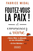
Foutez-vous la paix! Fabrice Midal