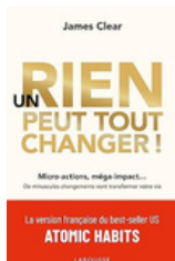
Un rien peut tout changer - James Clear Mon livre référence sur les habitudes.