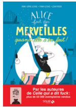
Alice fait des merveilles, quand elle s'en fout! A-S. et F. Lesage