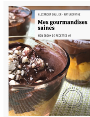
Mon premier ebook de recettes gourmandes