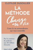
La méthode Change ma vie - Clotilde Dusoulier Pour construire la vie qui vous ressemble Existe en poche