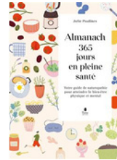
Almanach 365 jours en pleine santé Julie Pradines